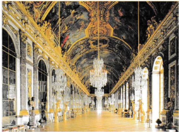
La galerie des Glaces.

Louis XIV, qui se fait appeler le Roi-Soleil, veut un château qui éblouisse le monde. Le peintre Charles Le Brun est chargé de la décoration. Les matériaux les plus précieux sont utilisés : marbre blanc pour les statues, fils d'or et d'argent pour les tentures... Une immense salle de réception est créée : la galerie des Glaces qui compte 357 miroirs ! C'est la pièce la plus spectaculaire du château.