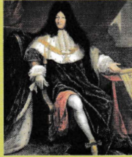
Le roi Louis XIV.