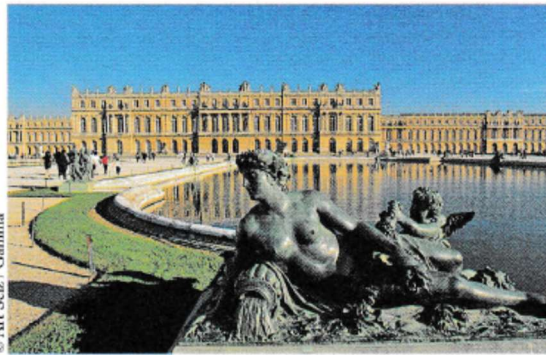
La façade ouest du château de Versailles.

Le roi Louis XIV réside à Paris. Mais il préfère le petit château de son père, Louis XIII, situé au milieu de la forêt, à Versailles. Il décide de l'agrandir pour en faire un château digne de sa puissance. Il veut y loger la famille royale et la Cour, qui compte des milliers de personnes.