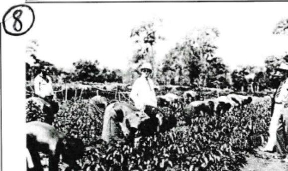
Scène de travail dans une plantation de café au Cameroun, au début du XX ème siècle.